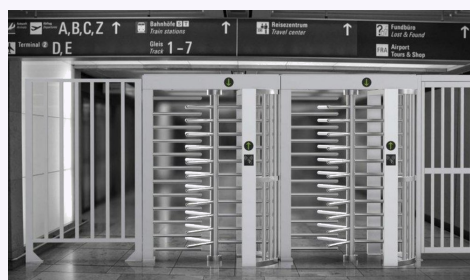
Inštalácia DS411 – letiská a stanice